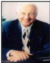
Dr. Robert Atkins, Penulis / Pakar Permakanan dan Kesihatan

"Dengan meminum air alkali, proses penuaan dapat disongsangkan dan sisa buangan boleh dikurangkan pada jangka masa panjang kepada seseorang individu yang lebih muda. Fungsi-fungsi organ dapat disegarkan kembali."