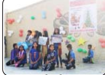
જીવનતીર્થ આપી હતી.

અમદાવાદ, ડિસેમ્બર, ૨૦૧૮ : કિસમસ નિમિત્તે જીવનતીર્થ ફાઉન્ડેશન દ્વારા તકવંચિત સમાજના બાળકોના આનંદ માટે એક કાર્યક્રમનું આયોજન કરવામાં આવ્યું હતું. આ કાર્યક્રમમાં ૨૦૦૦ બાળકો ઉપસ્થિત રહ્યા હતા જેમાં જીવનતીર્થ બાલ સંસ્કાર કેન્દ્ર, કન્યા કેળવણીની કન્યાઓ, રોજગારલક્ષી તાલીમ કેન્દ્રના વિદ્યાર્થીઓ, મહિલા બચત મંડળની બહેનો, આર.ટી.ઈ પ્રોજેક્ટના બાળકો અને અનુસંધાન સંસ્થાના બાળકો હતા. તેમાં ૨૫૦ બાળકોએ આ કાર્યક્રમમાં ભાગ લઈ સાંસ્કૃતિક કાર્યક્રમ, ધર્માવરણ વિશે, બેટી બચાવો બેટી પઢાવો અને પ્લાસ્ટિક ફ્રી જેવા નાટકો કરી લોકોને