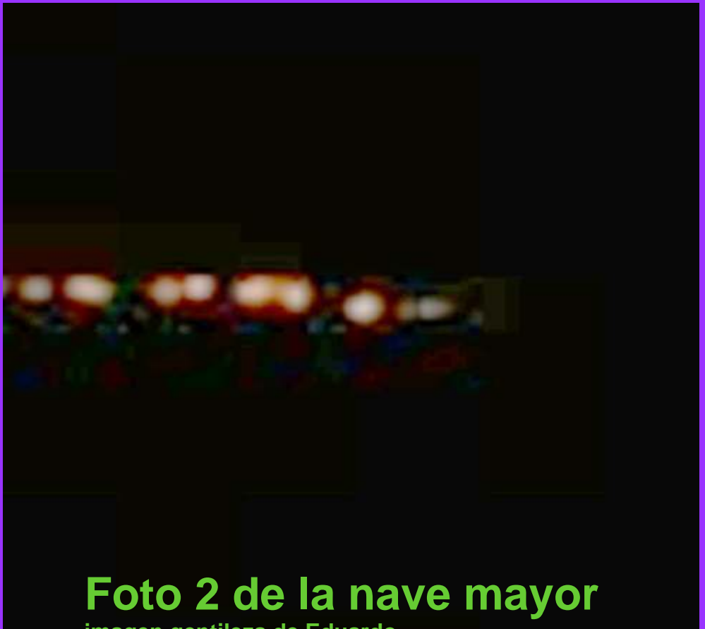
Foto 2 de la nave mayor