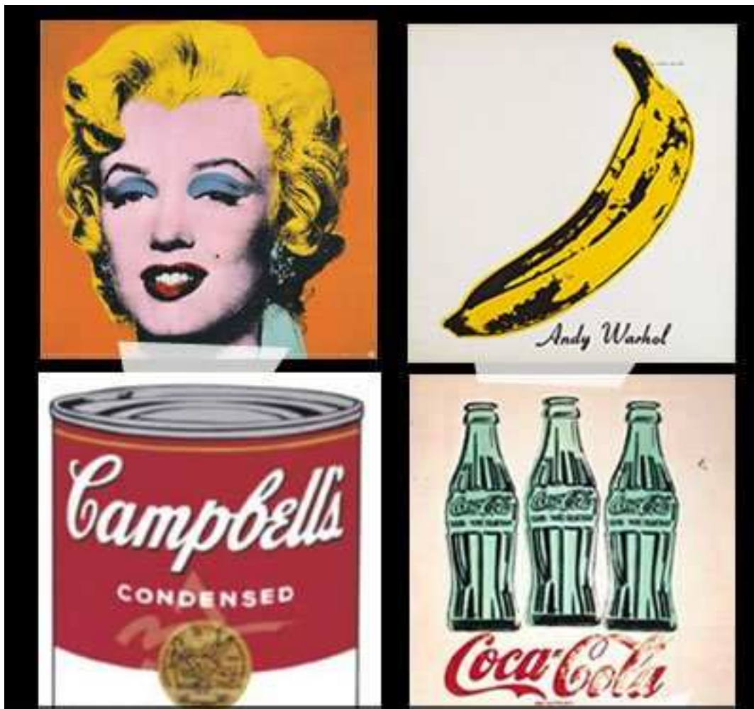
ANDY WARHOL na Estação Pinacoteca