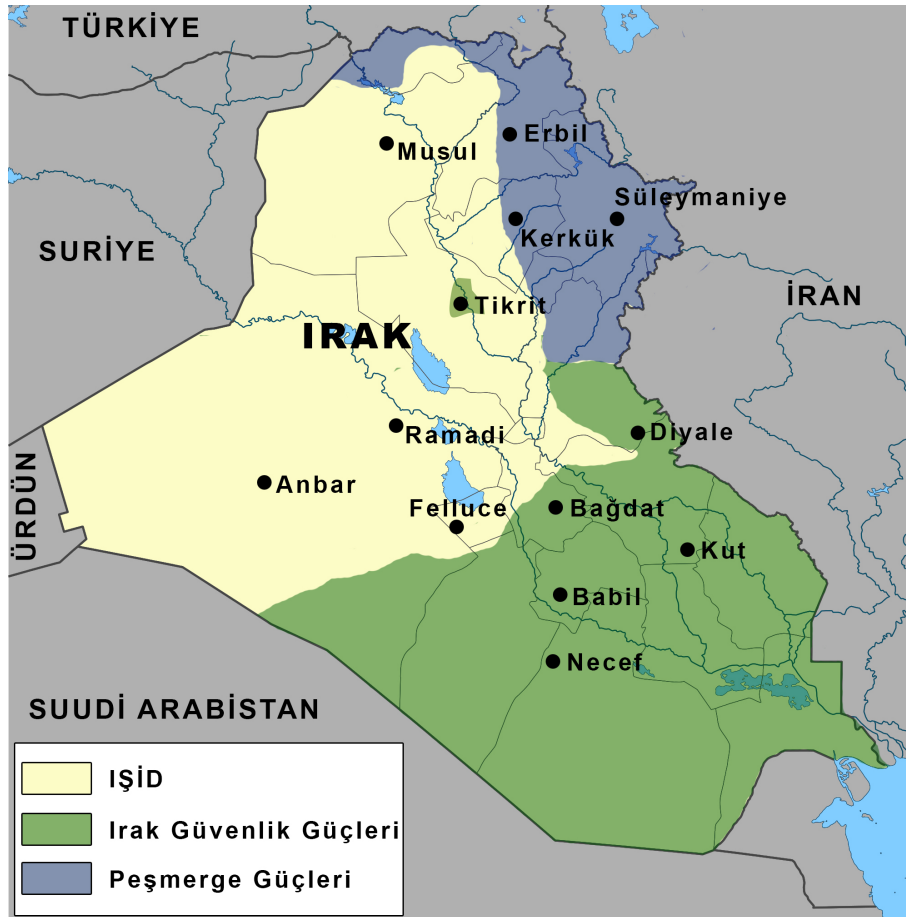
Harita 1: IŞİD'in Irak'ta Etkili Olduğu Bölgeler

kük kırsalında çatışmaya başladı. Türkmenlerin çoğunlukta olduğu Telafer'i ve Yezidi'lerin yaşadığı Sincar'ı ele geçirdi. IŞİD, İslam'a geçmeyen Yezidi'lerin kadın-çocuk ayırt etmeksizin öldürüleceğini açıkladı. Mahmur Kampı da IŞİD'in kontrolüne geçince PKK/KCK da Peşmergeler ve Türkmenler gibi IŞİD'le çatışmaya başladı. IŞİD'in Erbil'e yaklaşması üzerine ABD devlet başkanı Barack Obama, 8 Ağustos'ta ABD ordusuna müdahale yetkisi verdi ve IŞİD'e karşı hava harekâtı başladı. Ayrıca IŞİD'den kaçan azınlıklara da havadan gıda yardımı yapıldı. Beyaz Saray'dan yapılan açıklamada, Irak'a kara birliği gönderilmeyeceği ancak Irak'ta kapsayıcı bir hükümetin kurulması durumunda ABD'nin Irak'a askeri desteğinin artabileceği belirtildi. ABD, Erbil'de görev yapan ABD mensuplarının zarar görmesinden endişe duyduğunu dile getirdi. ABD Dışişleri Bakanı John Kerry, "İnsanların ölüme terk edilmelerini ABD izleyemez. ABD masum insanların kurtarılmasına karar vermiştir" dedi. 27