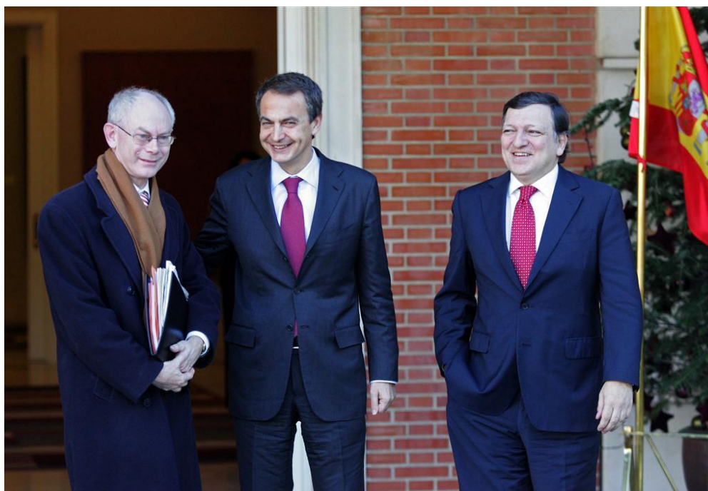
Herman van Rompuy, Președintele Consiliului European, José Luis Rodríguez Zapatero, primul ministru al Spaniei și José Manuel Barroso, Președintele Comisiei Europene la întâlnirea inaugurală a Președinției spaniole

Ne vom opri aici asupra primelor trei dintre aceste priorități, adăugând observații cu privire la importanța acestora pentru România.