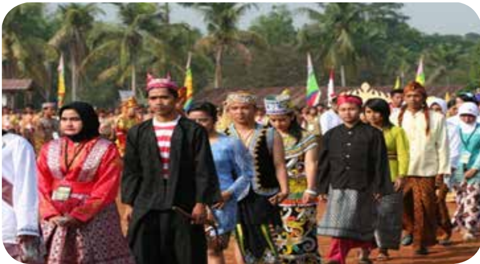
C. Parade Pakaian Adat 34 Provinsi di Indonesia