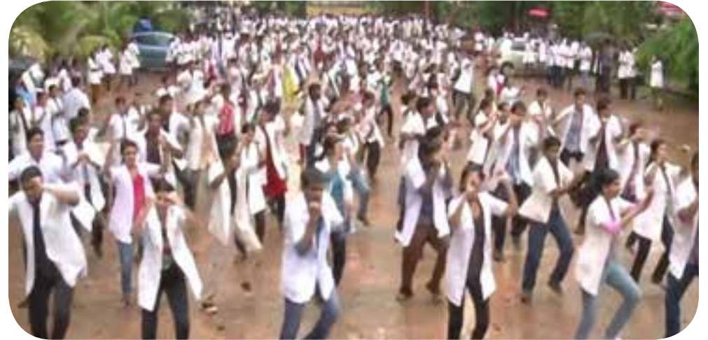
Doctors Flash Mob