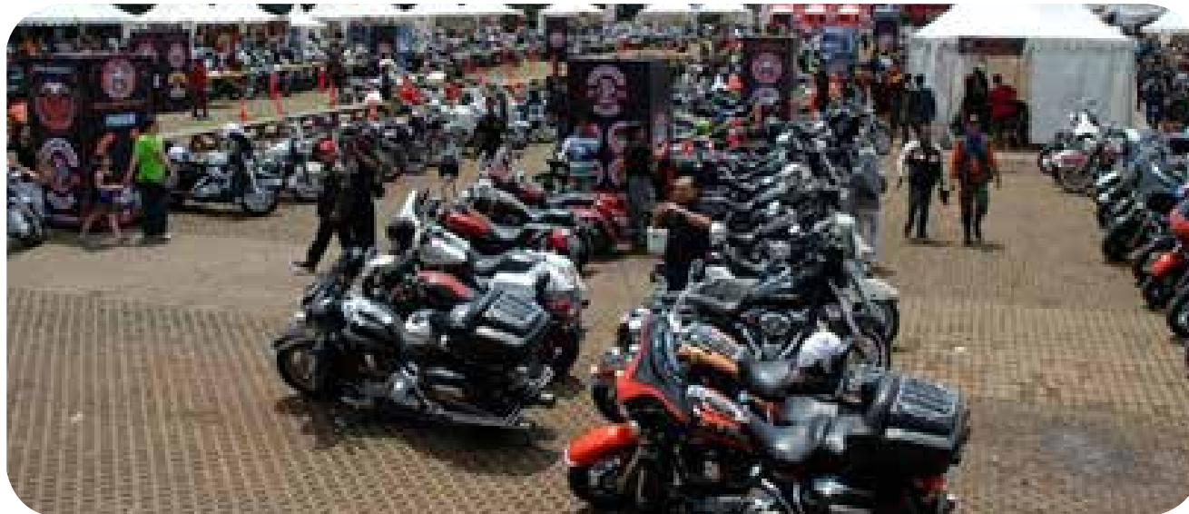
4. Komunitas Motor Gede (MOGE)