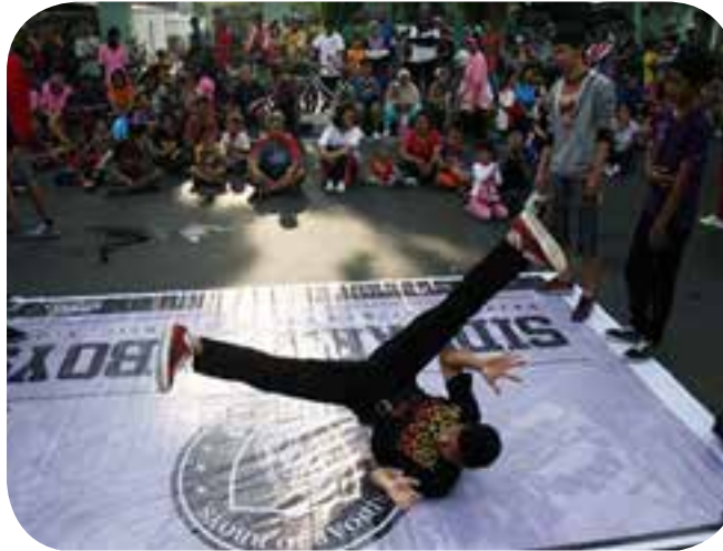
2. Komunitas Breakdance