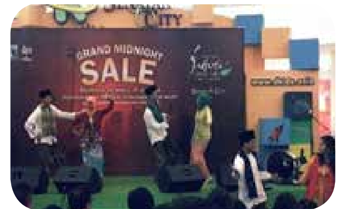
Abang Nene Jakarta