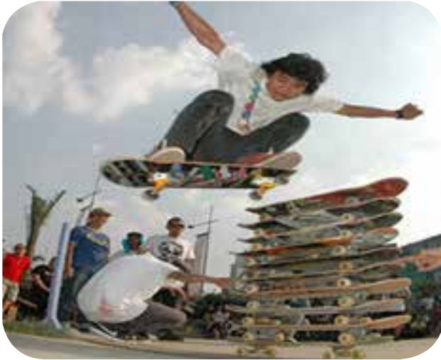
1. Komunitas Skateboard