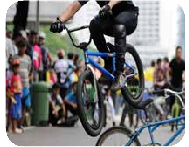
3. Komunitas Sepeda BMX