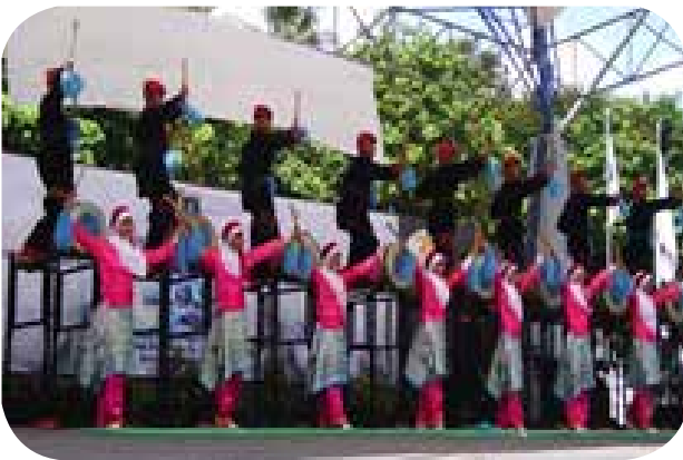
Rampak Beduk Banten