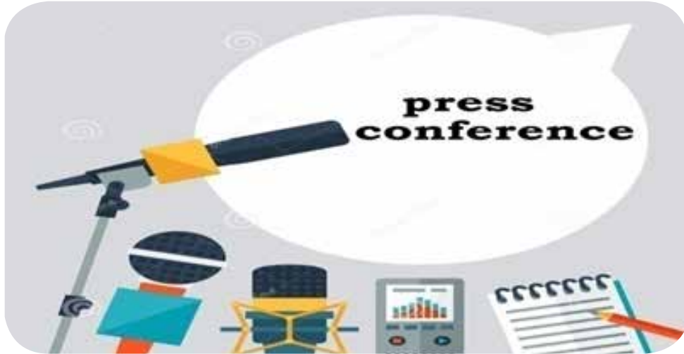
A. Press Conference