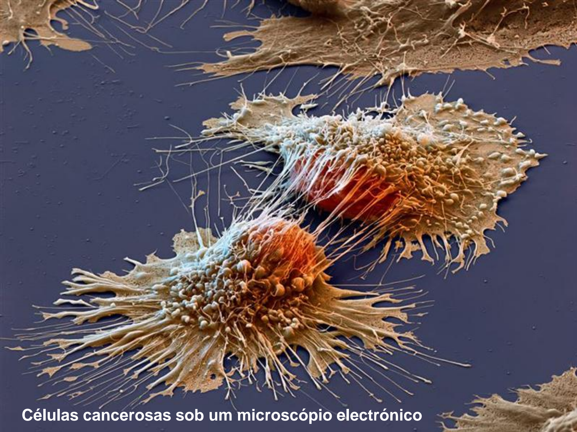
Células cancerosas sob um microscópio electrónico