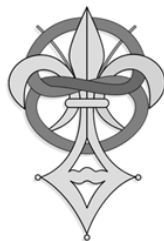
priory of sion