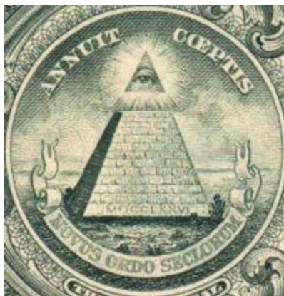
the Sun God (the all-seeing eye)

Pada logo Manchester United, terdapat satu ' devil ' yang sedang memegang ' garfu ' yang memang diketahui lambang tersebut adalah lambang syaitan. Perkataan ' Red Devil ' ( syaitan merah ) juga sesuai digunakan untuk menerangkan lambang berkenaan dan turut digunakan oleh Manchester United selain MUFC, Man Utd, Man U dan MU bagi melambangkan kelab berkenaan. Dua garisan merah di atas dan bawah logo dusatukan oleh dua biji bola yang terdapat di logo berkenaan membentek sebiji mata yg dikatakan oleh pengkaji konspirasi sebagai mata Ra atau Amon-Ra yang merupakan Tuhan Matahari bagi masyarakat Mesir Purba .