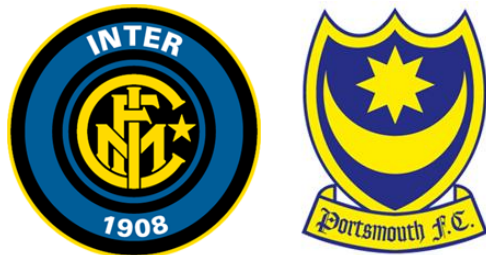
Masonic/Kabalistic Moon and Star