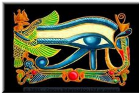
the one eye of Ra

perhatikan garis hijau yg membentuk mata dan perkataan united dibawahnya. United under the one eye?/ bersatu di bawah mata satu?