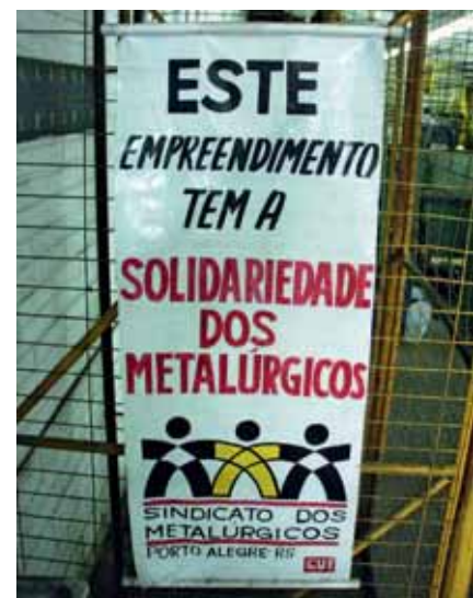
„Solidarität der Metallarbeiter“ für die Kühlerfabrik

Das Gespräch führte Gerhard Dilger, freier Journalist in Brasilien.