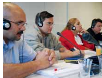
Teilnehmer der Brasilien-Tagung in Hattingen

Mit den Bedingungen von Leiharbeit in Brasilien und Deutschland wollen sich Beteiligte an gewerkschaftlichen Netzwerken in beiden Ländern stärker auseinandersetzen. Das haben sich Teilnehmende der Brasilien-Tagung des DGB Bildungswerk BUND im November in Hattingen vorgenommen. Leiharbeit müsse zurückgedrängt oder stark verteuert werden, hieß es; dafür sollen künftig Informationen ausgetauscht und nationale Aktionen wechselseitig unterstützt werden. Zu dem Treffen waren 18 Kolleginnen und Kollegen aus den Chemie- und Metallgewerkschaften des brasilianischen Dachverbands CUT nach Deutschland gekommen. José Drummond, der für die CUT gewerkschaftliche Netzwerke in multinationalen Unternehmen koordiniert, hob die Stärkung des sozialen Dialogs in Brasilien hervor: Dafür seien gesetzliche Reformen erforderlich, unter anderem Organisationsfreiheit und ein Recht der Arbeitnehmenden auf Information. In Brasilien gebe es gewerkschaftliche Netzwerke bereits in zahlreichen multinationalen Unternehmen.