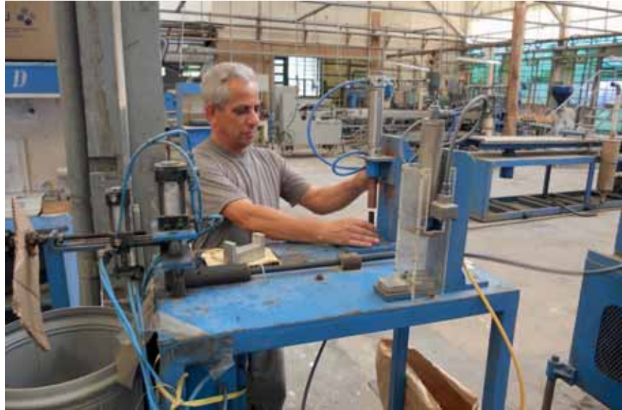
Arbeitsplätze erhalten: die selbstverwaltete Kühlerfabrik Cooperzago in Porto Alegre

Viele. Es wird zu wenig in Forschung und Entwicklung investiert, also in technologische Innovation. In einer Konkursfirma gibt es ja nicht nur heruntergewirtschaftete Maschinen. Das wichtigste ist der Erhalt der Arbeitsplätze, aber oft hinkt die